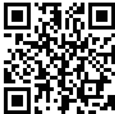
新規登録 QR コード